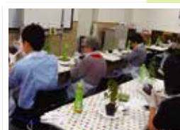
苔玉づくり教室風景

前回のイベントで好評だった「苔玉づくり教室」を開催します。苔を丸く仕立てる「苔玉」はとても人気です。その「苔玉」のつくり方を専門の講師が指導します。作った苔玉はお持ち帰りいただけます。