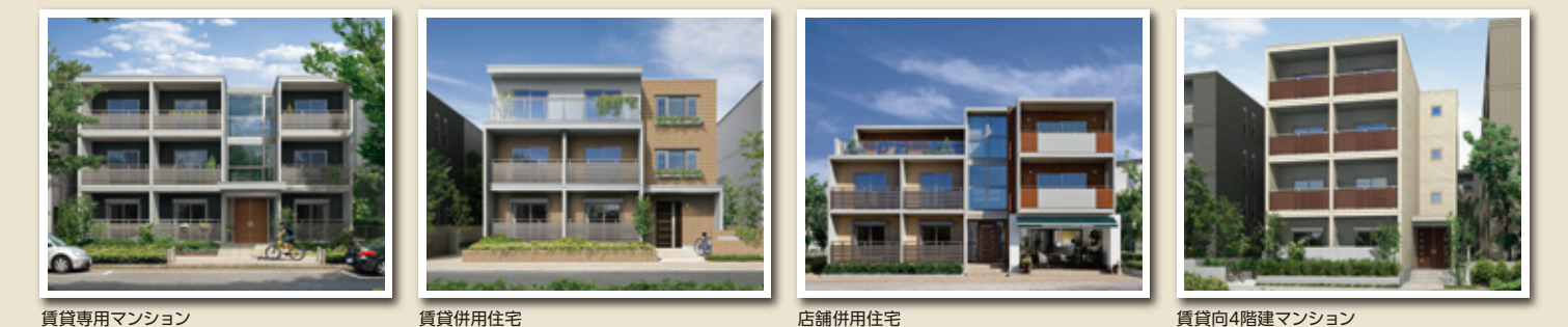
賃貸専用マンション